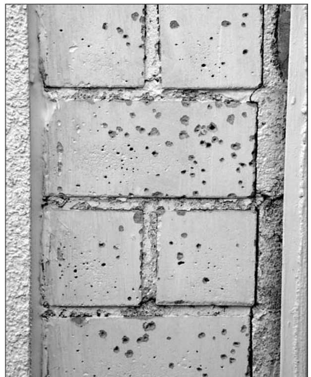
Bild 1: Fotografische Aufnahme von Frostschäden an einer Westwand aus Kalksandstein im Gelände der Freilandversuchsstelle Holzkirchen des IBP nach dem Winter 1998/99.

rechneten Wassergehaltsverläufe der äußeren 5 cm für eine Kalksandsteinwand ohne Beschichtung sowie mit einem defekten Farbanstrich dargestellt. Bei der gestrichenen Wand findet durch den Diffusionswiderstand der Farbschicht eine deutlich geringere Austrocknung statt, der Gesamtwassergehalt schwankt zwischen 11 und 13 M-%. Das bedeutet, daß die Gefrierpunktsunterschreitung oft bei Wassergehalten nahe der freien Wassersättigung stattfindet. Ab einem Wassergehalt von ca. 12 M-% wurde bei Kalksandstein das Auftreten von Frostschäden registriert [3]. Die unbeschichtete Wand hingegen nimmt bei Schlagregen Feuchte auf, gibt sie aber anschließend auch schnell wieder nach außen ab. Bis zum Zeitpunkt der Gefrierpunktsunterschreitung ist da-